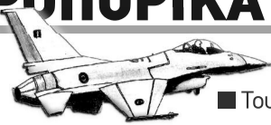
■ Του ΗΛΙΑ ΔΗΜΗΤΡΟΠΟΥΛΟΥ, ΑΡΧΙΣΥΝΤΑΚΤΗ ΤΗΣ «Ν.Φ»